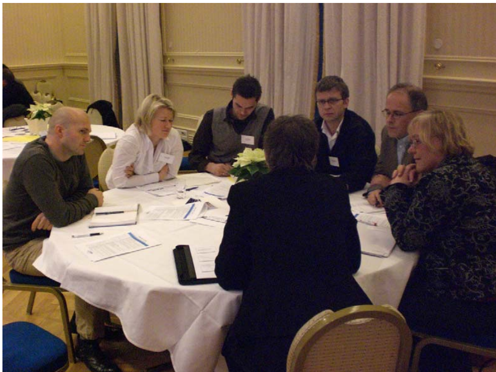
Figur 3. Klassiske rundebord diskusjoner og gullappseanser frambrakte mange gode innspill.