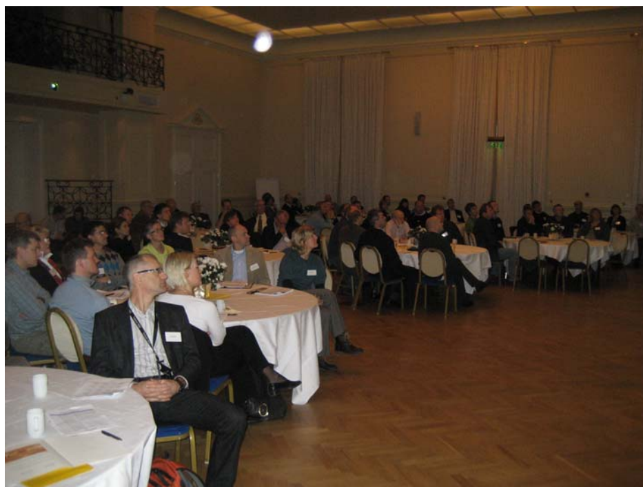
Figur 3. Lydhør forsamling under åpningen av TEKMAR 2008.

Presentasjoner og bilder fra TEKMAR 2008 er tilgjengelig på www.tekmar.no . Rapporten sammenfatter i hovedsak resultater fra temastasjonene.