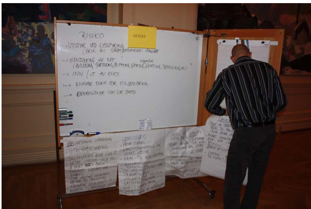
Figur 4. Resultater fra TEMA-stasjon 2 samles sammen.

Ledelsen har et spesielt ansvar for at sikkerhetstenkingen blir implementert på merdkanten (Figur 4). Folkenes kvaliteter må dyrkes og styrkes, og kurs/opplæring er viktig for å øke forståelsen og for å få til holdningsendringer. Det må videre stilles krav til faglært kompetanse ved bruk av elektrisitet på anlegget.