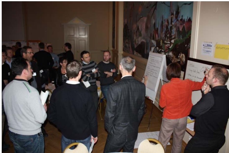
Figur 5. Fra arbeid på TEMA-stasjon "fôrplattform".

Under stasjonsarbeidet ble fôrplattformens ulike funksjoner kategorisert: